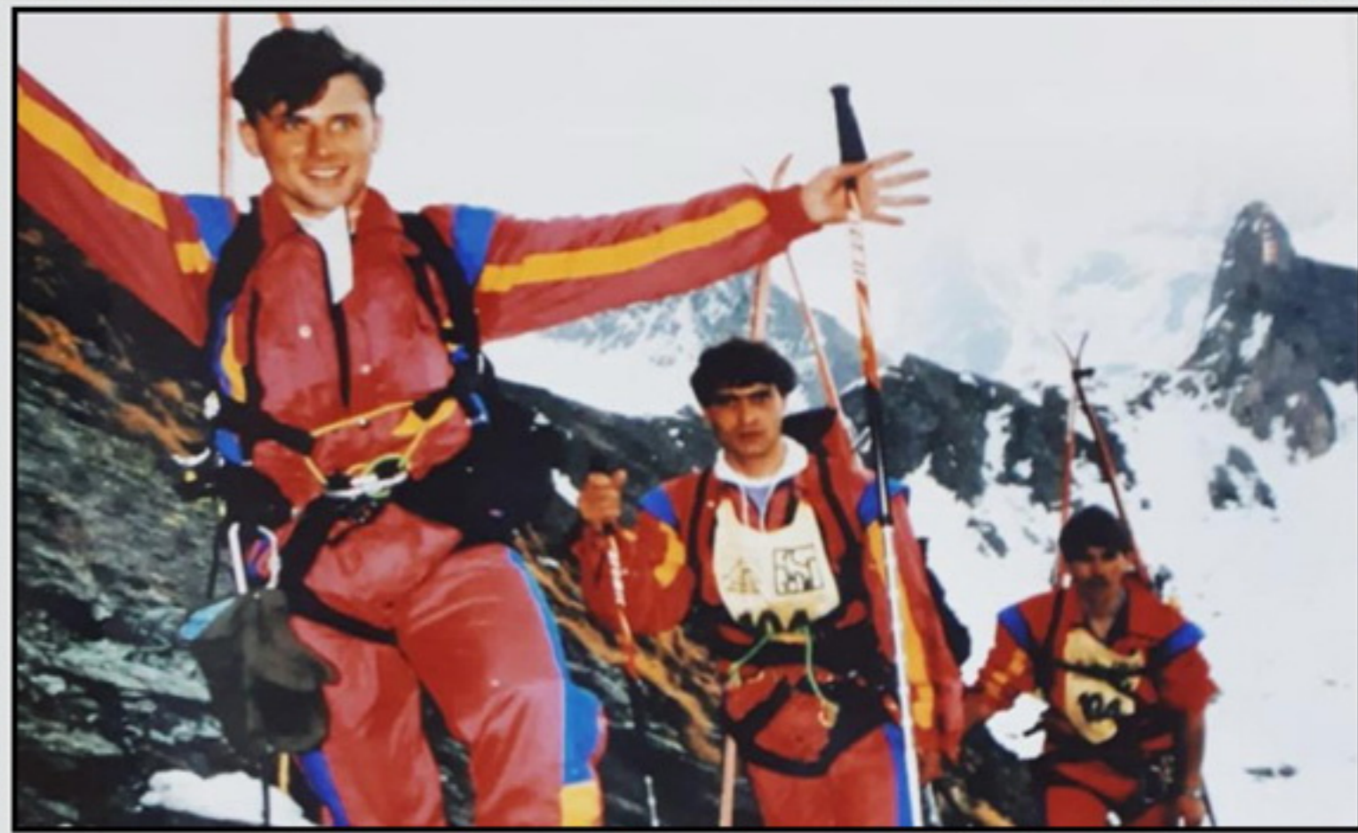
„Patrula Ghețarilor“, 1996, Elveția

Nu a câștigat primul loc chiar de la prima participare la un concurs, dar s-a remarcat ca fiind printre cei mai buni. Își aduce aminte că stagiul militar obligatoriu, pe care l-a satisfăcut la vânătorii de munte, a fost destul de dur, într-o perioadă