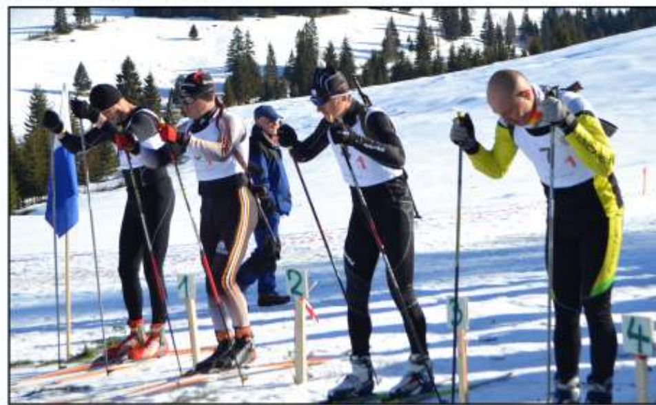
Gata de start, gata de victorie!

La finalul probei, câteva declarații ale învingătorilor: