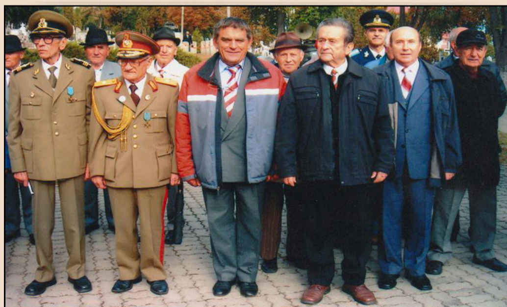
Membrii filialei județene Cluj a ANCMRR organizează anual o excursie de documentare și recreere