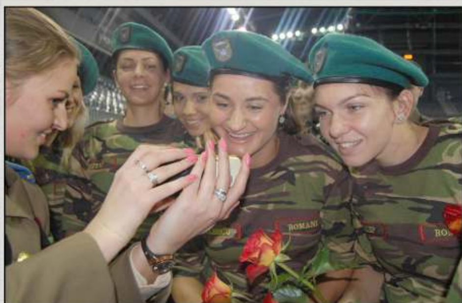
Zâmbetul unei campioane — Simona Halep

Toate anotimpurile au farmecul lor, dar parcă niciunul nu e atât de așteptat precum primăvara. O primim, an de an, ca pe o speranță. Natura își dă jos cojoacele, îmbrăcând, la primele raze de soare, o haină ce va fremăta în curând de scânteieri multicolore. Cu răbdare și siguranță, ceea ce până ieri era adormit se trezește la viață, aducând optimism, bună dispoziție și vitalitate. Nu întâmplător, tot acum sărbătorim și Femeia. Fără ea, existența noastră nu ar fi posibilă. Rândurile acestea ar rămâne nescrise. Doinele și cântecele de leagăn, nerostite. Cu aceeași răbdare, perseverență și speranță, Femeia dăruiește, cu generozitate, îmbrățișări, zâmbete, cuvinte. Se dăruiește pe sine. Nu a greșit cel care a spus că mâna care mișcă leagănul conduce lumea. De multe ori mama sădește în copii semințe ce vor rodi pentru întreaga umanitate. ■ Orizont militar