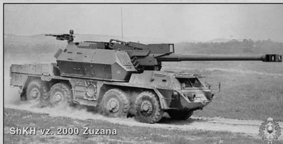
ShKH vz. 2000 Zuzana

permite executarea focului la mare distanță cu deplină acuratețe, timp scurt de pregătire și cadență mare de tragere, precum și o mobilitate deosebită, asigurată de șasiul modificat TATRA 8×8. Caracteristicile